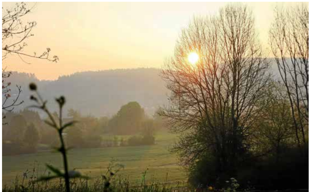
Das Licht am Ostermorgen 2014 über Seen