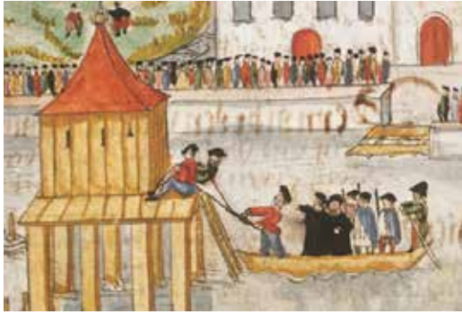
Täufer Hinrichtung aus dem Jahre 1528

Sonntag, 11. September, nachmittags Rundgang durch Zürich