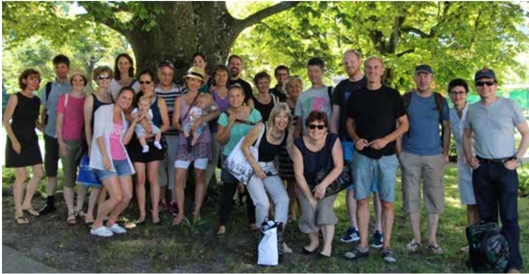
Foto: Leiterinnen und Leiter von Foren und Hauskreisen am Leitungsweekend 2015

In unserer grossen Kirchgemeinde gibt es für Menschen, die gerne im Kontakt mit anderen im christlichen Glauben unterwegs sind, verschiedene Möglichkeiten sich regelmässig im persönlicheren Rahmen zu treffen. Ein Forum ist ein solches Angebot. Momentan gibt es in Seen zehn Foren mit jeweils rund zehn bis zwanzig Personen, die sich alle 14 Tage treffen. Die Teilnehmenden decken alle Lebensphasen von jung bis alt ab. Die Treffen finden in Privathäusern statt, in der Regel am Abend. Es gibt auch ein Forum für Familien, wo man eher am Wochenende zusammenkommt.