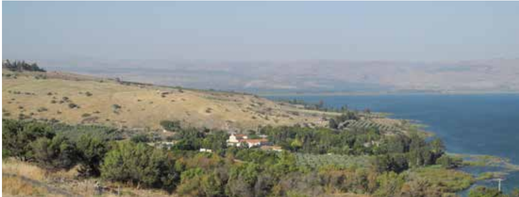
Gegend der Predigten Jesu am See Genezareth